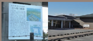
三ツ寺I遺跡 かみつけの里博物館