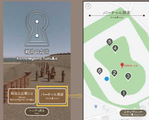
地図上の青い丸が現在地です。

2 トップページでのバーチャル探索ボタンから、現地の地図画面を表示します。 ※スマートフォンのGPS機能を有効にしてください。