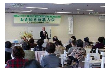
ぐんまときめきフェスティバル ときめき俳句大会