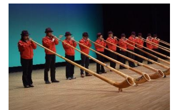
群馬県老人クラブ連合会 芸能発表大会