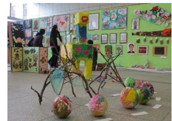
ハートフルアート展