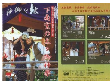
映像記録 DVD（下南室太々御神楽保存会）