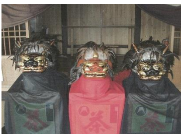
獅子頭の修繕（浜川町獅子舞保存会）

各地域の伝統文化（民謡・民舞、神楽、歌舞伎、獅子舞、人形芝居、祭り囃子、山車その他の伝統芸能や、地域の年中行事など）の適切な保存、継承、発展を図るための支援事業として、活動に必要な道具の購入や修繕、映像記録による保存、子どもや活動の担い手を育成する講習会や発表会の開催などの取組を支援しています。