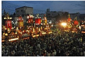
沼田祇園祭 (沼田市)