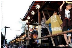
世良田祇園祭 (太田市)

こうした地域が抱える課題を把握し、市町村と連携しながら、伝統文化を次世代に残そうとする意欲のある団体を支援します。