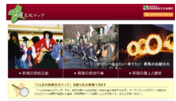
ぐんま地域文化マップ