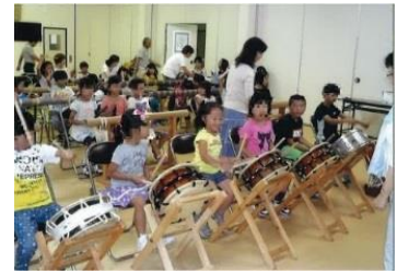
祇園囃子の練習会 (子ども伝統文化継承事業)