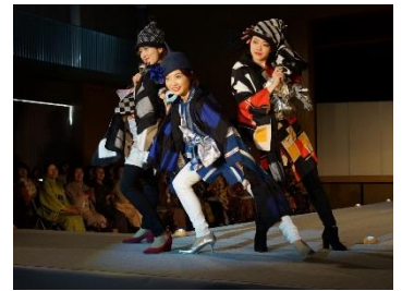
伊勢崎銘仙ファッションショー (文化力向上事業)

また、地域の文化を磨き上げ、県内外等に本県特有の文化の魅力を発信する取組を支援します。