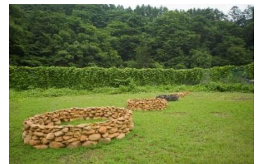
中之条ビエンナーレ (文化資産発掘・活用事業)