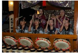
大間々祇園まつり (みどり市)