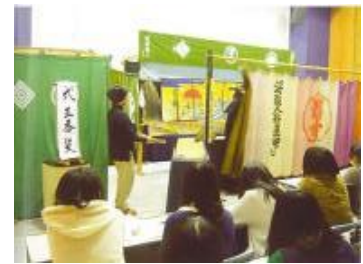
伝統文化のボランティア支援 (伝統文化サポーター事業)