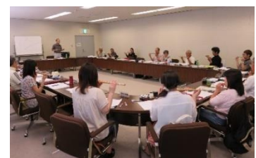
篠笛の技術講習会 (伝統文化継承モデル事業)