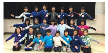
キッズミュージカル公演 (次世代育成事業)