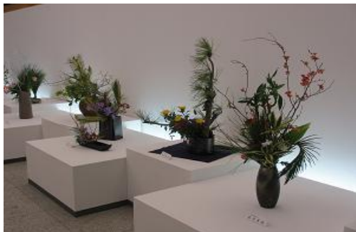
県民芸術祭（県展（華道展））