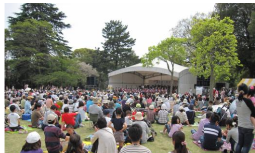
県民芸術祭 （森とオーケストラ（群馬の森公園））