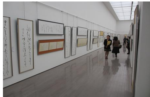
県民芸術祭（県展（書道展））