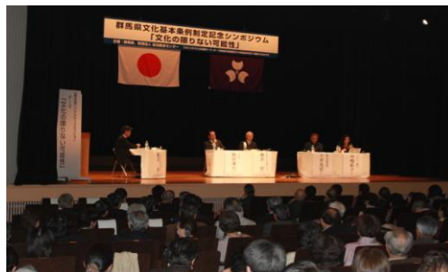
文化基本条例制定記念シンポジウム (パネルディスカッション)