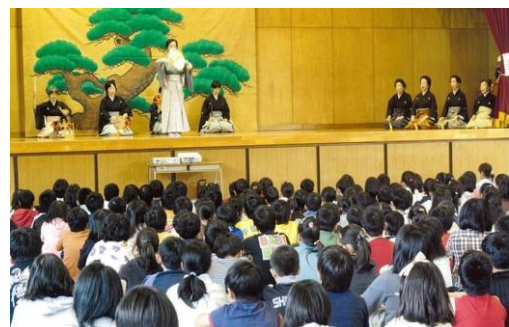
はじめての文化体験事業