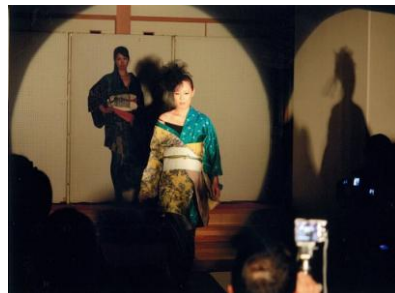
地域の文化資産を活かした新たな取組（伊勢崎銘仙ファッションショー）