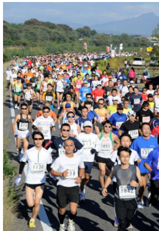
ぐんま県民マラソン