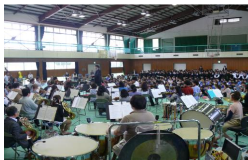
群響移動音楽教室