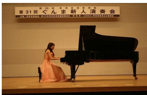
ぐんま新人演奏会（県民芸術祭）