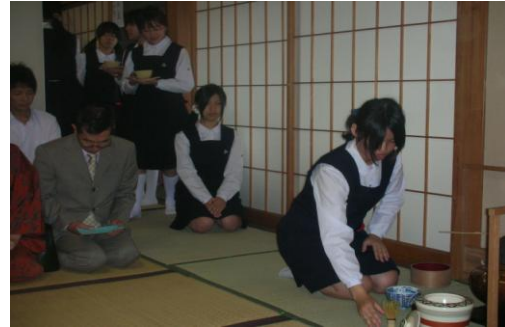
県民芸術祭（県展（大茶会））