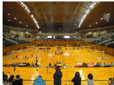
総合スポーツセンター （ぐんまアリーナ）