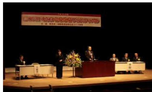
ぐんまときめきフェスティバル