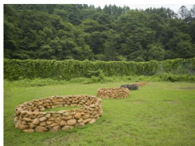
芸術を活かした創造性豊かな地域づくり （中之条ビエンナーレ）