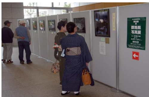
県民芸術祭（県展（写真展））