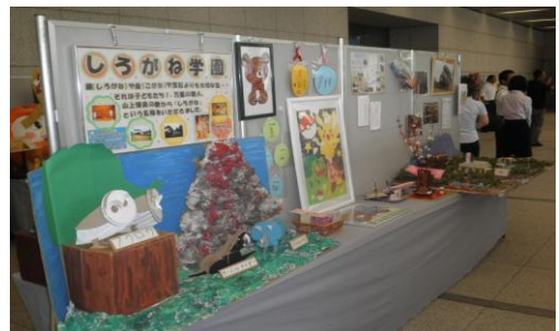
知的障害児者施設製作品展示 (群馬ナイスハートフェア)