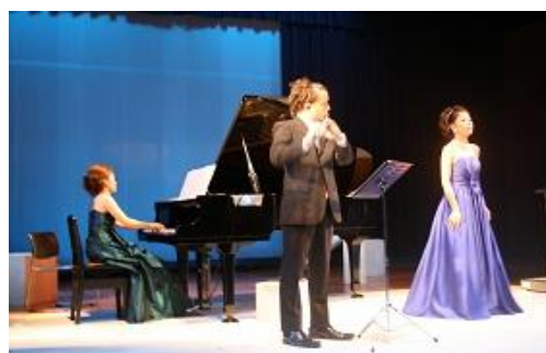
新進演奏家支援事業 「グリーンコンサート」（県民芸術祭）