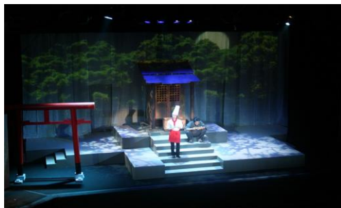
県民芸術祭（演劇制作事業「絹の国から」）