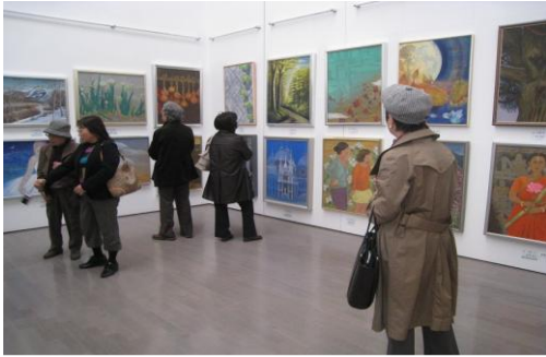
県民芸術祭（県展（美術展））