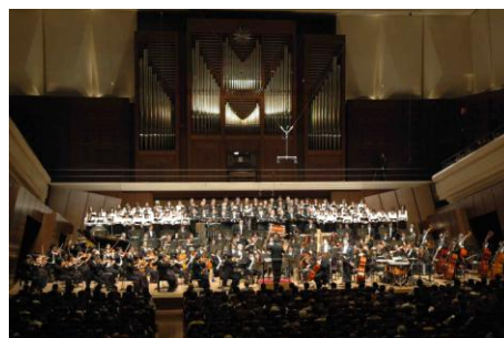
群馬交響楽団支援（群響東京公演）