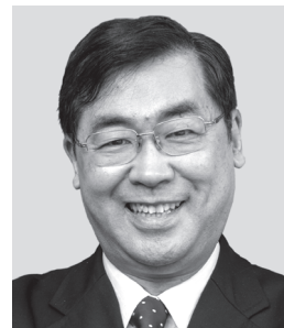
まつだ まなぶ 松田学 全国比例区第1支部長 元衆議院議員。未来社会プロデューサーとして、国の借金をお金に変える「松田プラン」や日本が世界のモデルとなる「日本新秩序」を提唱中。