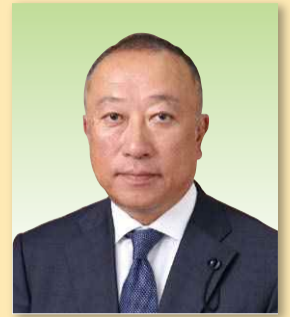
群馬県議会副議長 井下 泰伸 (伊勢崎市・3期)