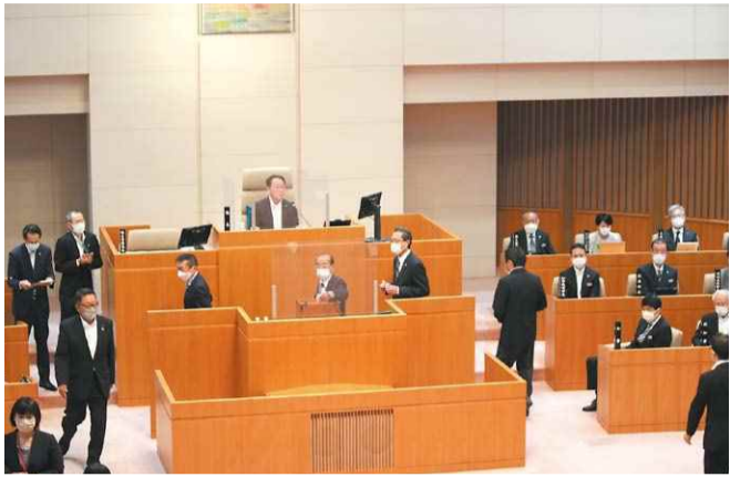
議場 副議長選挙 (5月24日)

令和4年第2回定例会で正副議長、各常任委員会、各特別委員会(4面参照)などの議会構成が決まりました。