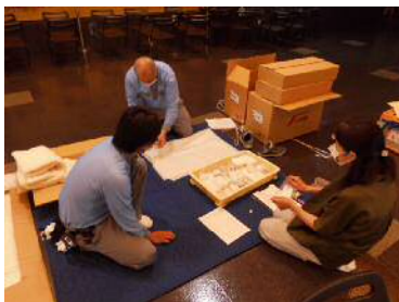
多くの方に知ってもらうために・・・ 文化財展示貸し出し事業