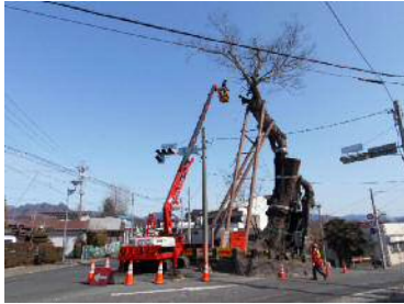
天然記念物を守るために・・・ 剪定作業