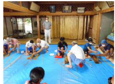
地域の伝統技術を引き継ぐために・・・ 子供たちへの体験事業