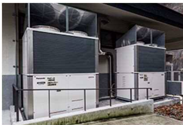
自立機能付ガスヒートポンプエアコン

平常時は多目的ホールとして利用し、災害時には1,000名収容の避難所となるコンベンションホールに、自立機能付きガスヒートポンプエアコンを導入。平常時は空調設備として運用しながら、災害時には自家発電装置としても活用が可能。