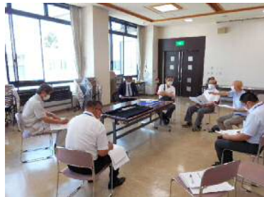
重要文化財を知るために・・・ 研究機関と連携調査