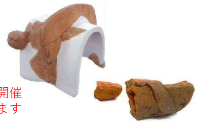
ミニ企画展示「今月の逸品！」の開催 ※1か月に1回対象を変えています