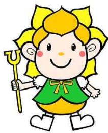
東吾妻町マスコットキャラクター 水仙ちゃん