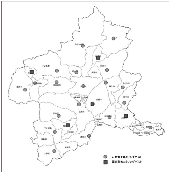
図2-4-4-1 モニタリングポスト配置図