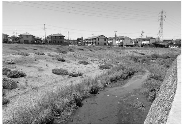
一級河川寺沢川 前橋市

ている自然の復元力を活用できるよう配慮し、約1.0kmの多自然川づくりを実施しました。