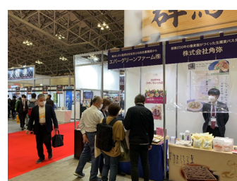
(2022年3月「FOODEX JAPAN 2022」群馬県ブースの様子)