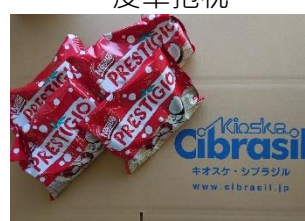
Prestigio 巴西餅 乾 2,000 日圓