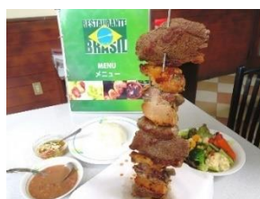
巴西餐廳 餐券 2,000 日圓