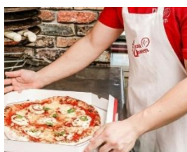
巴西披薩 L 尺寸 1 片