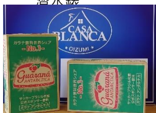
Guaraná 汽水 1 箱(350ml×24 本)