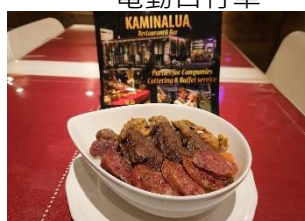
巴西烤肉蓋飯 2 人份套餐