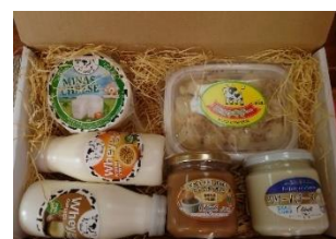
チーズギフトセット