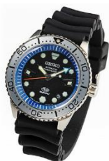
ダイバースウォッチ