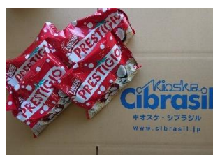
プレスティージュ 2,000円分