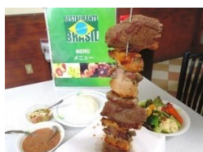
レストランブラジル 食事券2,000円分