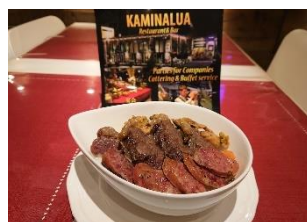
シュラスコ丼 ペアセット