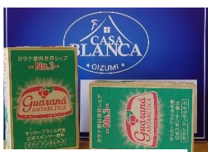
ガラナ 1 ケース (350ml×24本)