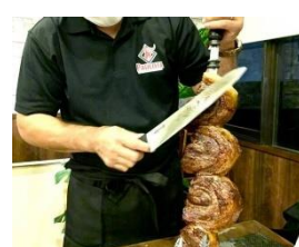
シュラスコ食べ放題