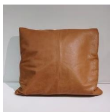
レザークッション