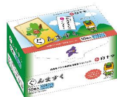
サージカルマスク