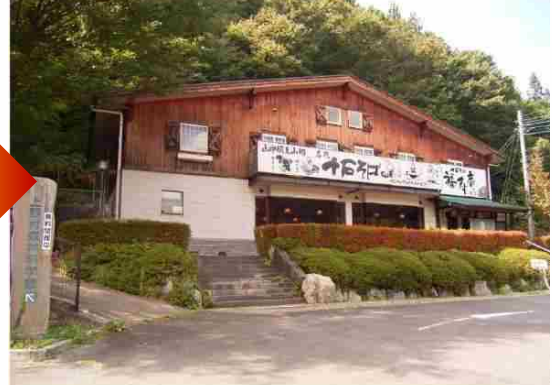
ふるさと交流センター（避難所）