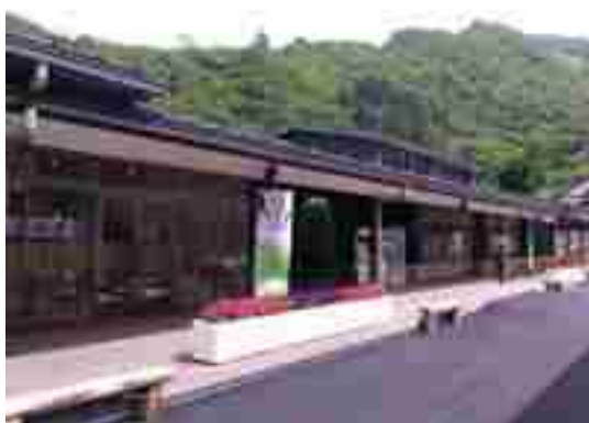
道の駅上野（近隣施設）

地域の避難施設をがけ崩れなどの土砂災害から保全することで、異常気象時に近隣住民が安心して避難することができるようになるため、安全・安心な住環境が創出されます。