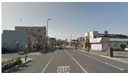
同じ市内（ほかの場所）の整備状況