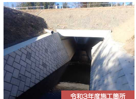
令和3年度施工箇所