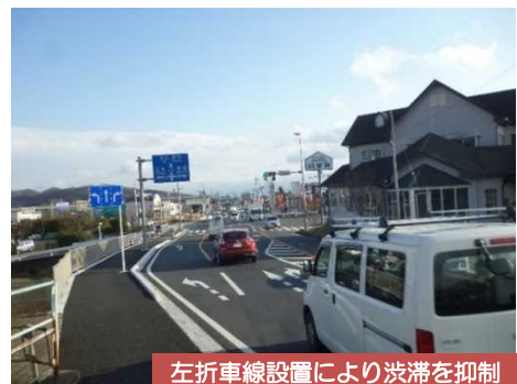
左折車線設置により渋滞を抑制