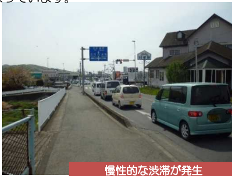
慢性的な渋滞が発生