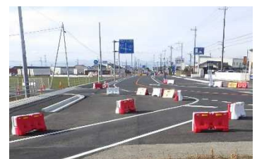
太田市みどり市境界付近

用地の取得が完了した箇所から順次道路改良工事を進めています。 令和4年度は継続して用地取得を進めるとともに、道路改良工事を実施します。