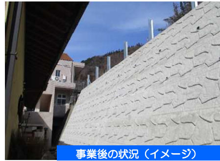
事業後の状況（イメージ）

◆擁壁をつくることにより、落石や崩落した土砂を受け止め、がけ崩れによる被害のリスクを軽減します。