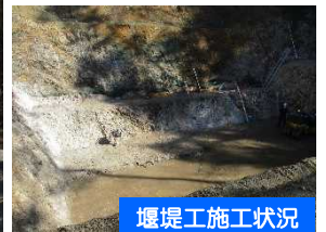
堰堤工事施工状況