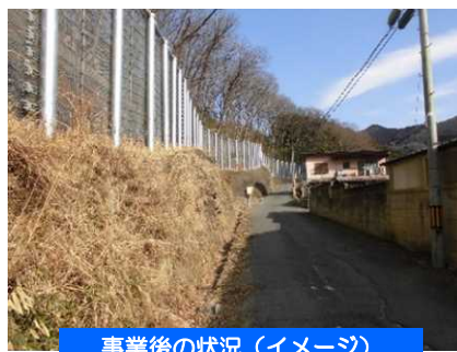
事業後の状況（イメージ）

◆法枠の整備により、斜面の風化を 방지、がけ崩れによる被害のリスクを軽減します。