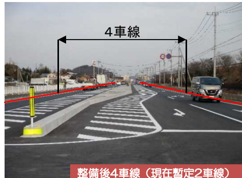
整備後4車線（現在暫定2車線）