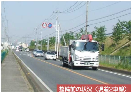
整備前の状況（現道2車線）