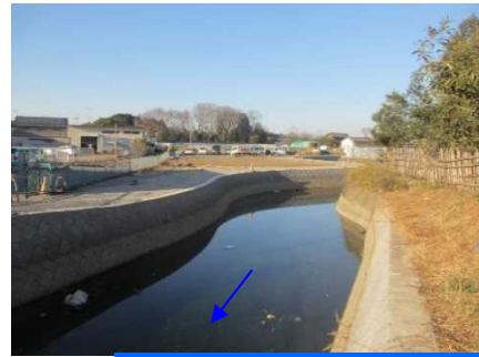
河川拡幅後（中流1工区）