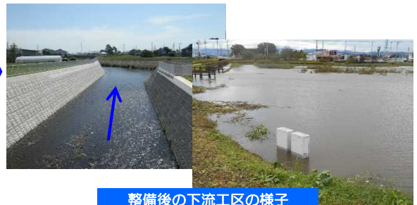
整備後の下流工区の様子

◆川幅を拡げ、流せる水量を増やすとともに、調節池に水を貯めることにより下流へ流れ込む水の量を減らし、河川の氾濫による被害のリスクを軽減します。