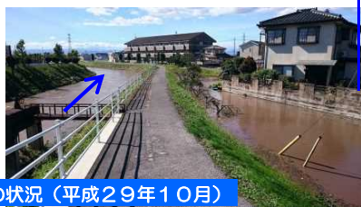
洪水時の状況（平成29年10月）

◆集中的な降雨があった際、河川への流入量が増え、浸水被害が発生しました。（平成29年10月）