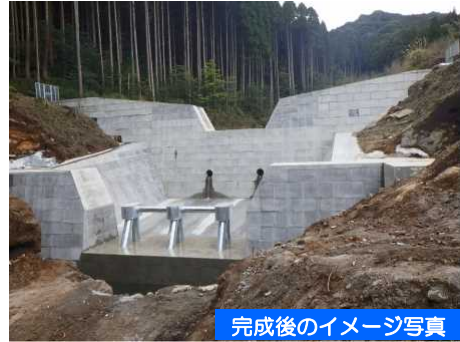
完成後のイメージ写真