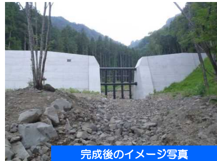
完成後のイメージ写真