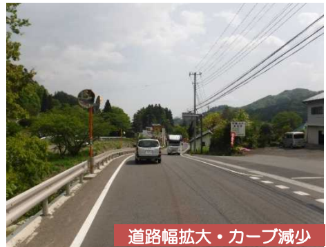
道路幅拡大・カーブ減少

◆道路を広げることで対向車と安心してすれ違いができるようになり、円滑な通行を確保しました。