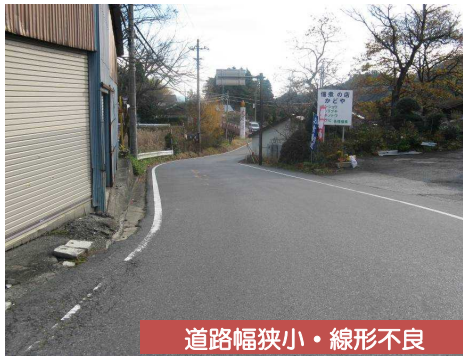
道路幅狭小・線形不良