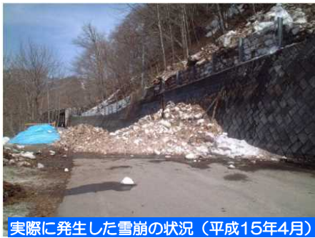
実際に発生した雪崩の状況（平成15年4月）