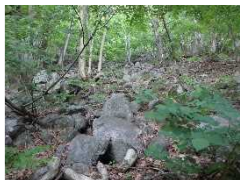
斜面上部の転石状況