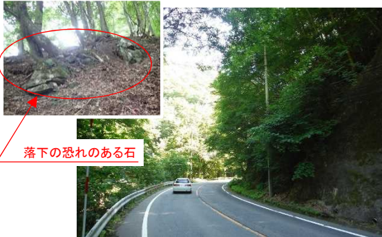
落下の恐れのある石

◆道路脇の法面は浸食が進み、大雨等の際に落石や土砂崩落により道路が寸断するおそれがあります。