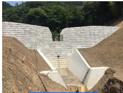
完成後のイメージ