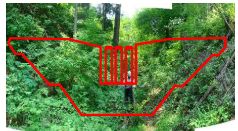
買収予定地の現況と砂防堰堤のイメージ