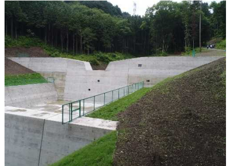
完成後のイメージ