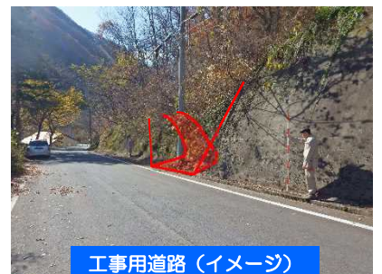
工事用道路（イメージ）