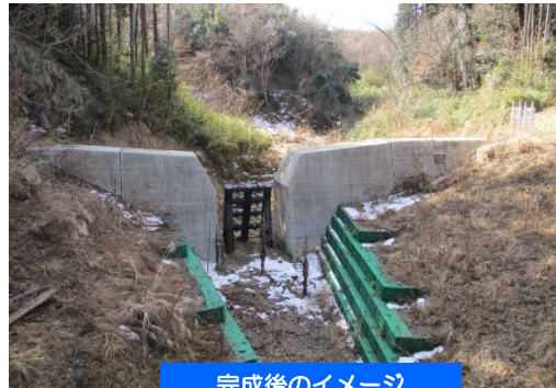
完成後のイメージ