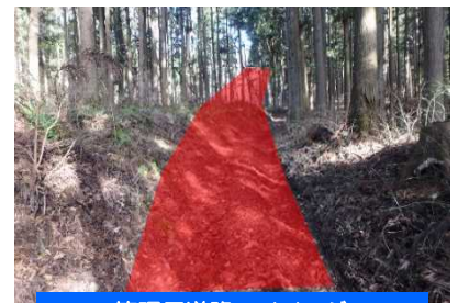
管理用道路のイメージ

令和3年度は、堰堤より下流の溪流保全工の設計を実施しました。 令和4年度は、管理用道路の工事を実施します。