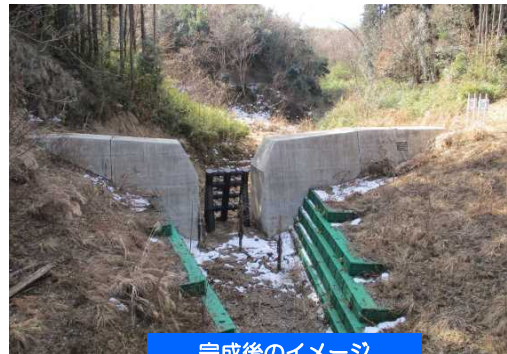
完成後のイメージ