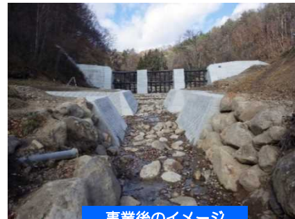
事業後のイメージ