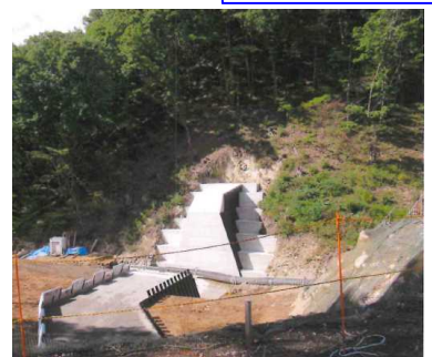
第2砂防堰堤施工状況