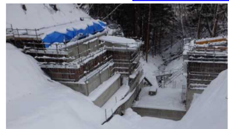
砂防堰堤施工状況