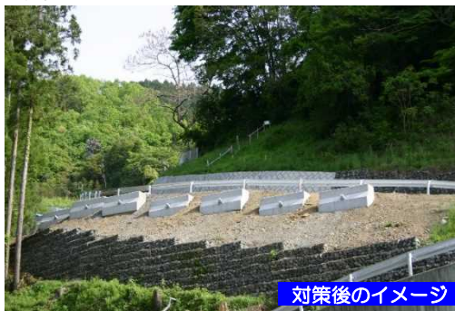
対策後のイメージ