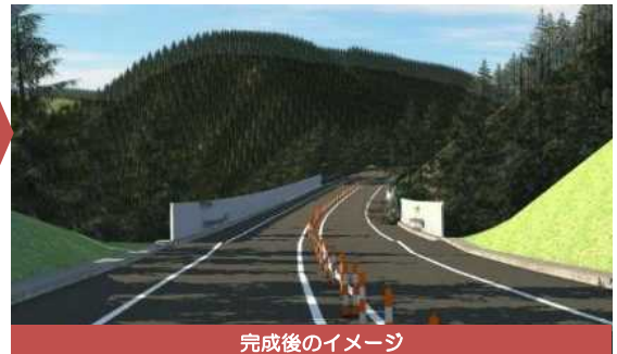
完成後のイメージ