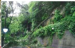
H28年 倒木による通行規制