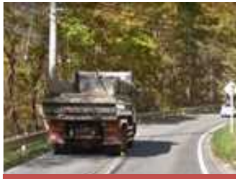
国道144号幅員狭小状況