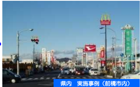
県内 実施事例(前橋市内)

◆電線を地中化して電柱を撤去することで、電柱の倒壊による交通の寸断がなくなるとともに、良好な都市景観が創出されます。