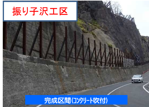
完成区間(コンクリート吹付)