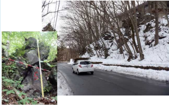
斜面上の転石、浮石

◆道路脇の法面は浸食が進み、大雨等の際に落石や土砂崩落により道路が寸断するおそれがあります。