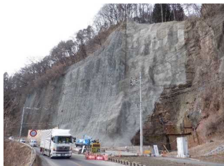
完成区間（コンクリート吹付）