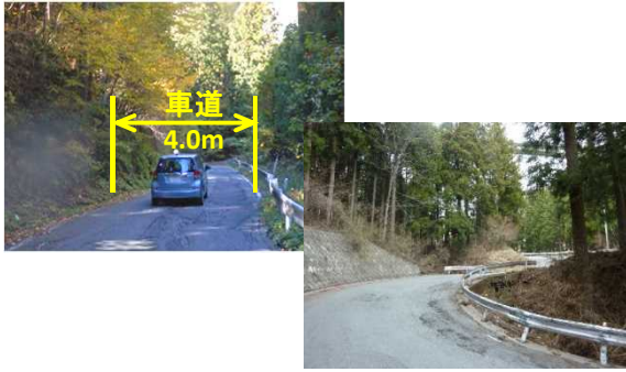
道路幅狭小・線形不良