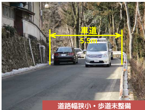
道路幅狭小・歩道未整備