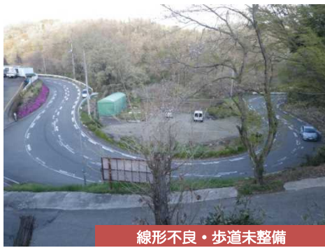
線形不良・歩道未整備