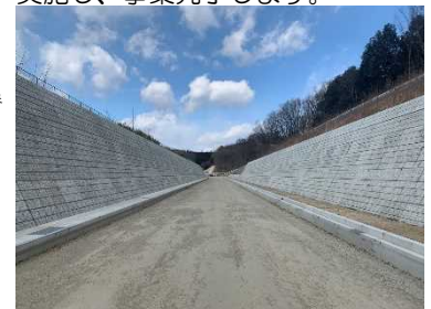
R4.1 改良済区間 (富岡市側から安中市側)