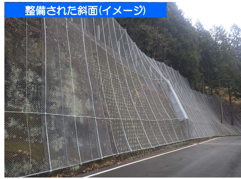
整備された斜面(イメージ)