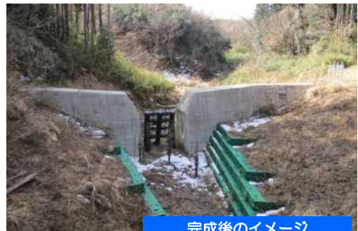
完成後のイメージ