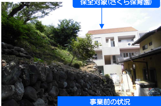
保全対象(さくら保育園)