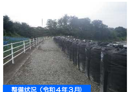
整備状況（令和4年3月）